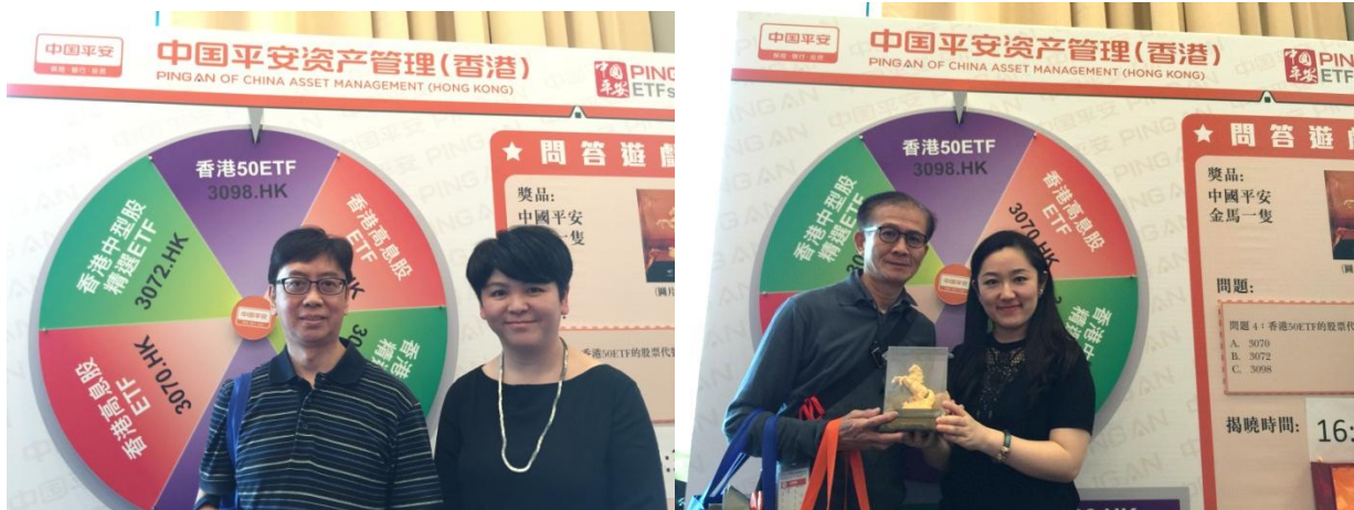
問答遊戲優勝者分別獲贈平安金馬擺設一隻。