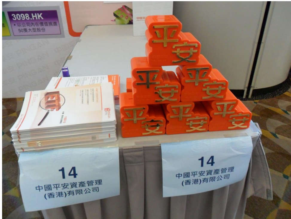
博覽上設有平安禮品包供投資者索取，內附ETF產品冊子、便箋及精美錢箱。