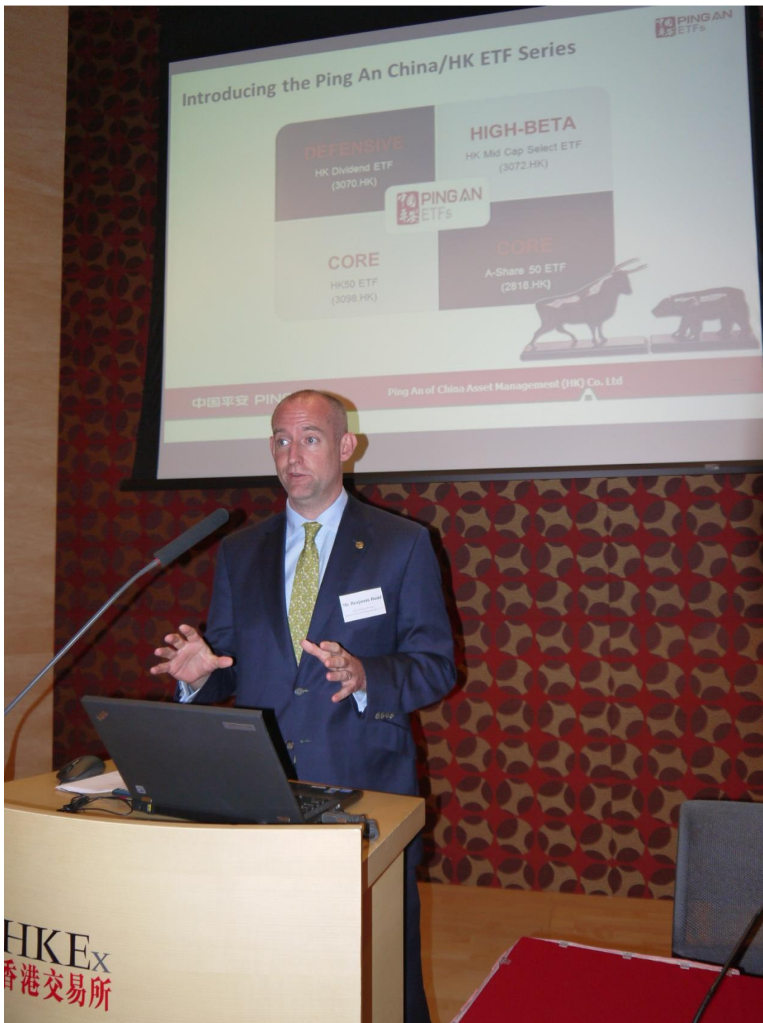
本睿先生介紹中國平安中港 ETF 系列，並分享他在投資組合管理上的睿見。