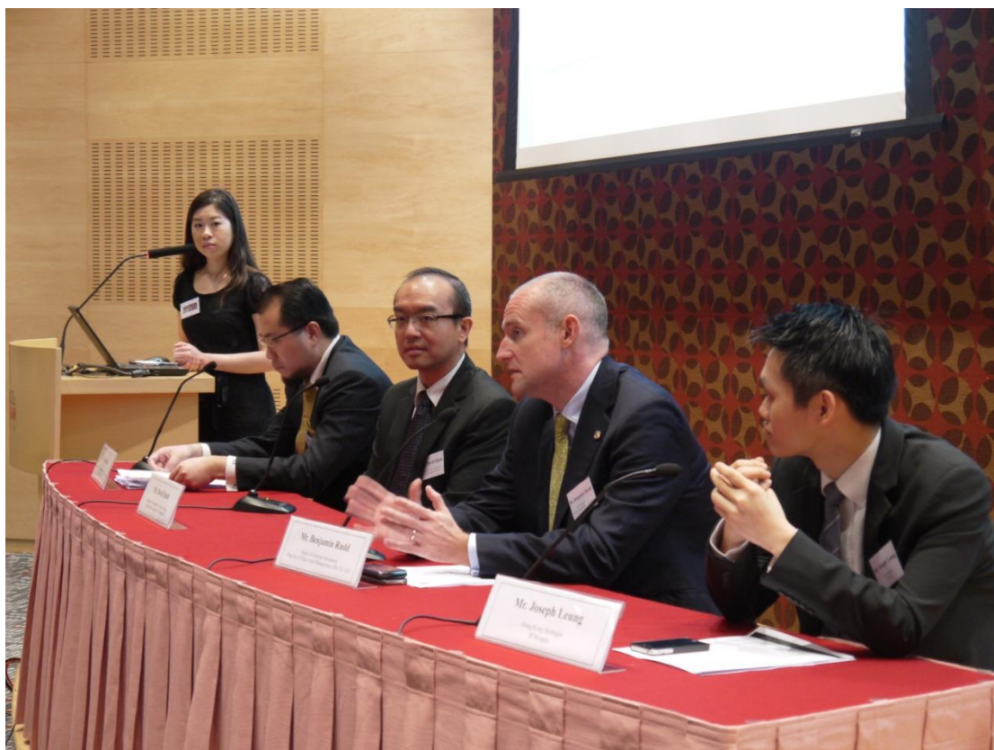
各位講者於座談會中解答觀眾有關 ETF 投資的問題。